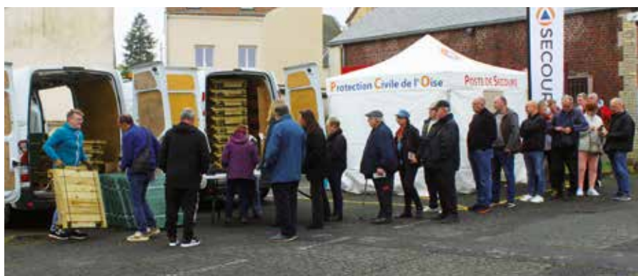
À l'occasion de la Fête du sol vivant le samedi 26 octobre à Rantigny, 50 composteurs ont été remis aux habitants.