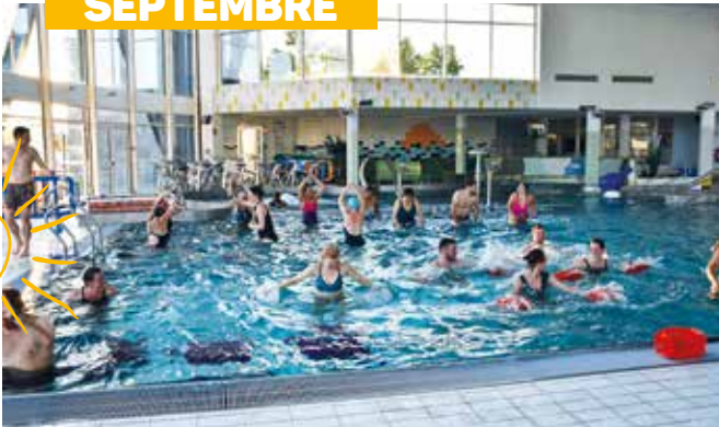
Lancement de la nouvelle activité "circuit training" : un succès immédiat auprès du public.