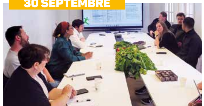
Visite du chantier d'insertion Les Pouces Verts à l'Hôpital Paul Doumer de Labruyère : l'occasion de faciliter les rencontres entre les acteurs de l'emploi du territoire, les services intercommunaux et les demandeurs d'emplois.