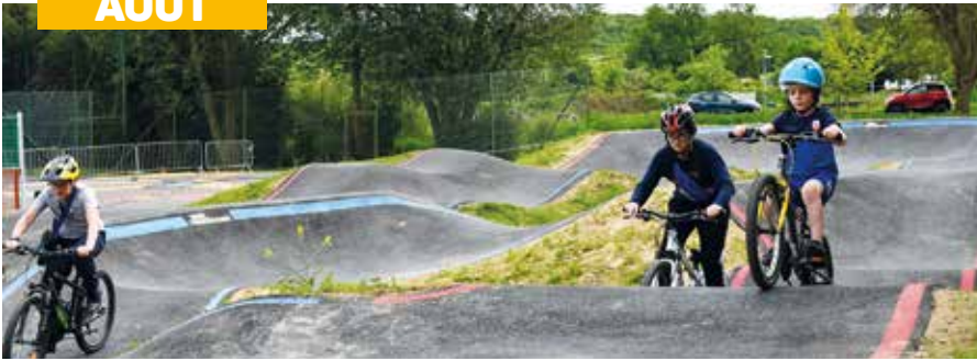
La pumptrack a enchanté les enfants durant toute la période estivale au parc Chédeville.