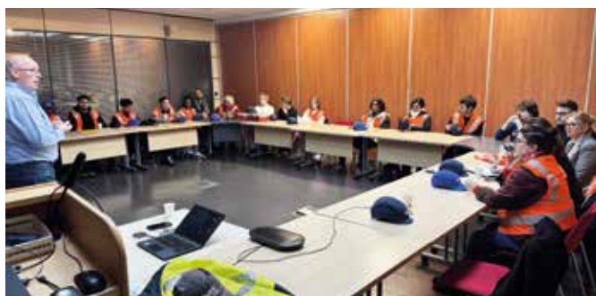
Dans le cadre de la Semaine de l'Industrie, plusieurs sites ont ouvert leurs portes, comme l'entreprise Isover Saint-Gobain de Rantigny, la station d'épuration ou encore le château d'eau où ingénieurs et techniciens ont parlé de leurs métiers.

professionnel Roberval à Breuil-le-Vert, le lycée professionnel Marie Curie à Nogent-sur-Oise.