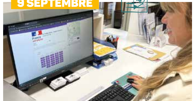
Prendre directement rendez-vous en ligne avec nos services, c'est désormais possible. Plus besoin d'appeler ni de vous déplacer.